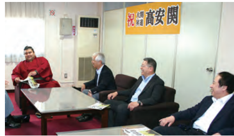
6月9日に来所された高安関と田嶋（左から2人目）、小坂（同3人目）、横山（右端）の三副会頭

高安関は、平成生まれ初の日本出身大関。今後も、気迫に満ちた相撲を期待しております。