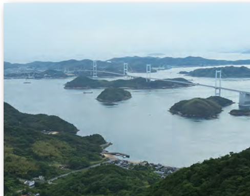
日本屈指の展望スポット、亀老山から見たしまなみ海道

今治市と尾道市を結ぶ高速道路。瀬戸内海に浮かぶ島々を、風光明媚な景観に溶け込む9本の様々なデザインの橋で結んでいる。自動車だけでなく、自転車や歩いても渡ることができ、国内外からサイクリストがゆったりとした島旅を楽しむ観光スポット。