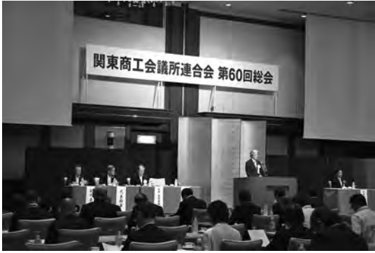
一都八県103商工会議所の連携を強化し課題解決に取り組んでいくことを確認。

報告決算報告、事業計画予算等が審議され、すべて可決承認された。特に、29年度の事業計画の重点活動として、前橋市で開催予定の「全国商工会議所観光振興大会」に全面的に協力することや、2020年東京オリンピック・パラリンピックに向け、管内での気運醸成に取り組んでいくことを決定した。