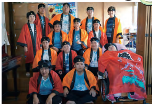
障害があっても社会貢献できる大人になりたいと、まちの行事にすすんで参加していきたい