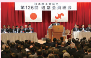
全国396商工会議所から、正副会頭等を迎え盛大に開催された

「平成28年度事業報告(案)」について、(1)復興の加速化と福島再生の早期実現、(2)デジタル脱却と地方創生を旨とした政策提言活動を展開、(3)新たな挑戦を行う中小企業をワンストップ・ハンズオンで支援、(4)地域の資源を徹底活用した地域力の再生・成長の促進、(5)企業の海外展開支援の強化、(6)地域・企業における少子化への対応や若者・女性の活躍を支援、