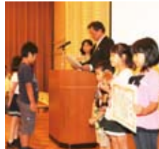
会頭より賞状とトロフィーを授与