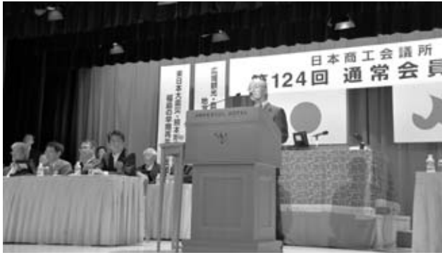
安倍首相、世耕経済産業大臣等来賓をむかえ、あいさつする三村会頭

冒頭、三村会頭は、「日本経済の成長力を高めるために強固な成長基盤を構築しなければならない」と強調。潜在成長率引き上げのためのサプライサイド政策の実行を政府に求めるとともに、「商工会議所のネットワークを最大限活用して、山積する諸課題を乗り越えていきたい」と決意を述べた。