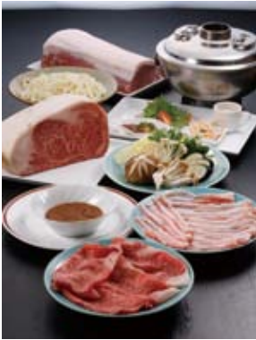
飯村牛を使った しゃぶしゃぶコース