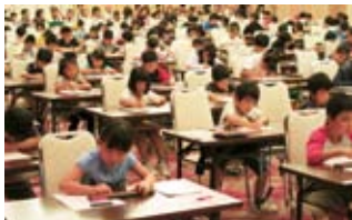
真剣に取り組む参加者の皆さん