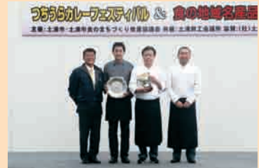
昨年のC-1 グランプリ表彰式