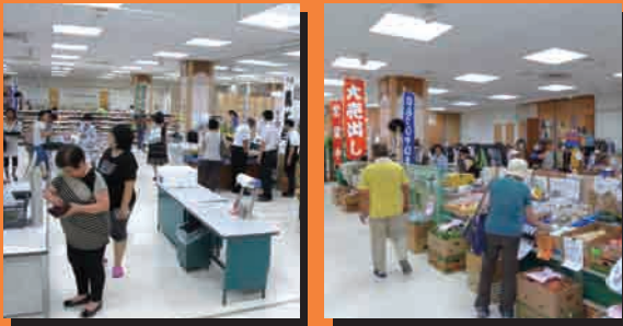
物販店や作品展示等多彩な業種が集っている