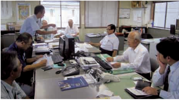
エコシルフィの県内唯一の総代理店をつとめる

私も深澤通信工業(株)は、昭和45年5月の設立以来、時代の先端技術を取り込みながら、『情報通信・環境システム』事業を核とした事業展開をしております。弊社の歩みは着実にお客様の信頼に繋がりに、茨城県内