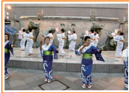
新郷土民謡おどり