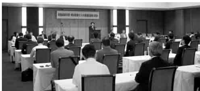
多くの来賓をむかえ盛大な総会となった