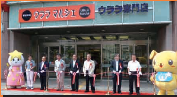
7月15日にオープン式典を行った