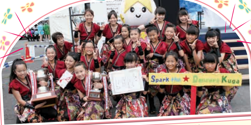
七夕おどり優勝のSpark the ☆ Dancers Kuga連