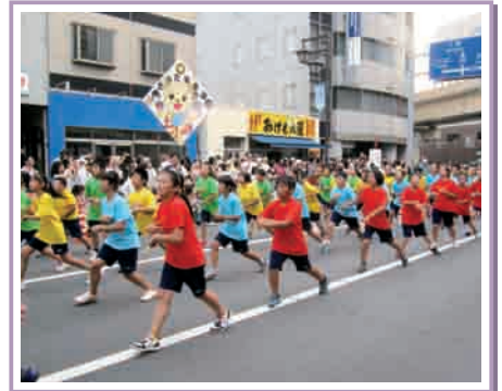
ジュニア賞の土小たまき連