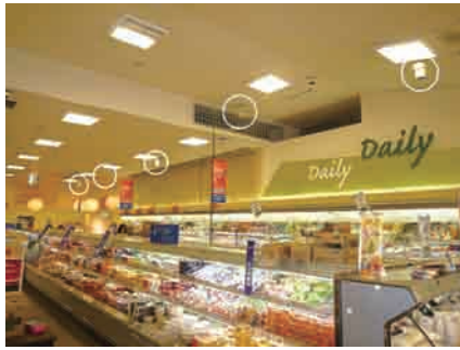
スーパー 冷えとカビ対策に