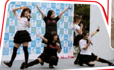
T-Princessをはじめ、多くのご当地アイドルが出演したキララ広場会場

土浦の夏を彩る「土浦キララまつり2013」が8月3日、4日の2日間にわたり市内目抜き通り、旧水戸街道(中城・本町通り)、を中心に開催され16万人の観客を集めた