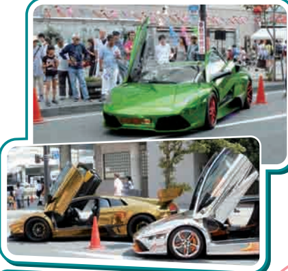
うらら広場でのランボルギーニ大集合