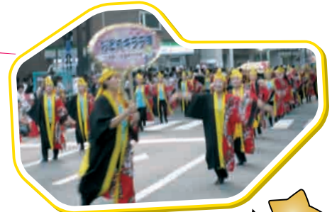
当所女性会も参加