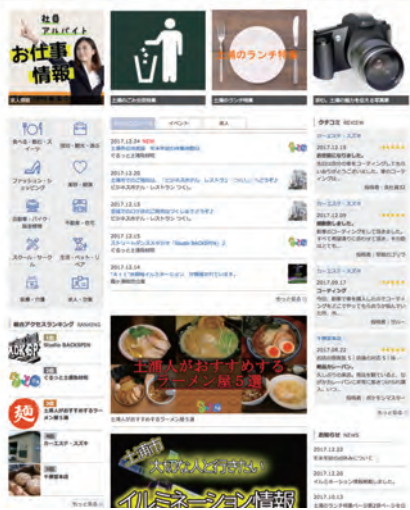
ホームページ「ぐるっと土浦」も開設