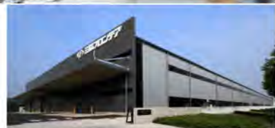
つくば工場(テクノパーク土浦北工業団地内)

●安定した仕事 ●事業拡大 ●新規参入(異業種歓迎)をお考えの会員様 まずはお気軽にお問い合わせください!