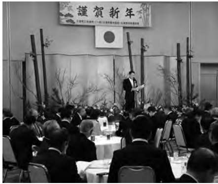
250名が参加し盛大に開催された