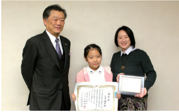
左から中川会頭、山内さん、小平先生