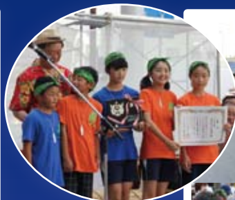
ジュニア賞の 荒小Dream連