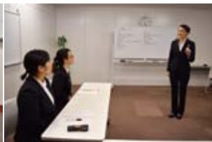
質問の繰り返しによる意識改革 セミナー コース