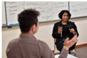
急な海外出張にも対応 ハイスピード英会話