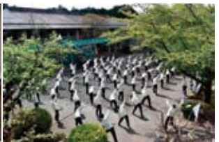
富士宮市に自社訓練施設を保有 訓練 コース

MEMBER'S NOW! 掲載事業所募集 あなたの企業、店舗・技術の情報を掲載してみませんか？ 事業案内、人物紹介、新製品や商品紹介 etc. 会員企業の情報をお知らせし、取材の上、無料で掲載させていただきます。お気軽にお電話ください（総務課 8202-0300-100）。