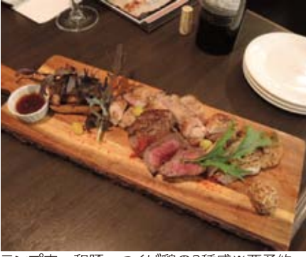
ラム肉、和豚、つくば鶏の3種盛※要予約

※これからのシーズンは、飲み放題付き宴会コース5,000円(120分制)をご用意しております。 是非、旬な料理とワインをお楽しみください。お気軽にご予約、ご相談お待ちしております。