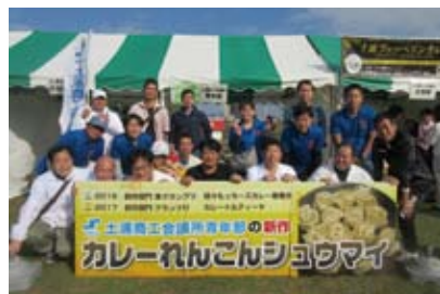
メンバー団結しグランプリを目指した

11月9日・10日、北海道帯広市で行われた「第36回日本Y.E.G.全国会長研修会 実り大き北の大地」とかち帯広会議に18名で参加した。全国会長研修会は、3年後に土浦開催予定であるため、会員総会から全体研修、大懇親会、2日目の分科会、次年度開催地への引継ぎ会議まで参加し、土浦開催に向けて運営方法等を確認することができた。また、全国から集まった会員との交流で、今後の活動にためになる取組みも知ることができ、有意義な2日間であった。