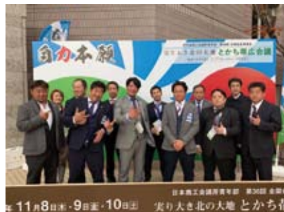
全国会長研修会にメンバー18名で参加

11月10日・11日には、11月例会として、「第15回土浦カレーフェスティバル」に出店した。年度初めからメンバーの協力の下、試作・開発した「カレーれんこんシウマイ」を販売。トップにカレー風味のピリ辛もやしを追加する工夫をして臨んだ。ご来場の皆さまに大変ご好評をいただき、用意した1000食を完売することができた。また、この好評に応えるべく、今後「カレーれんこんシウマイ」をメンバーの飲食店でレギュラーメニュー化し、フェスティバルとY.E.G.の相乗効果によるカレーのまち土浦の活性化を目指す。