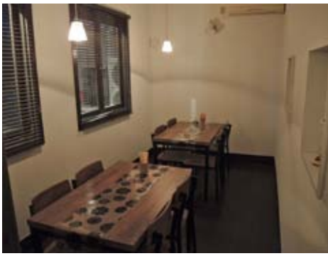
落ち着いた完全個室

MEMBERS, NOW! 掲載事業所募集 あなたの企業、店舗・技術の情報を掲載してみませんか？ 事業案内、人物紹介、新製品や商品紹介etc.: 会員企業の情報をご掲載させていただきます。無料で掲載させていただきます。お気軽にお電話ください(総務課8201-03001まで)。