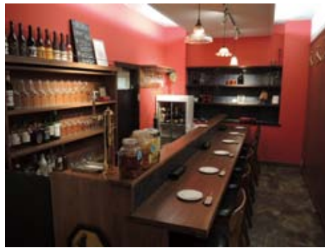
新設したバーカウンター