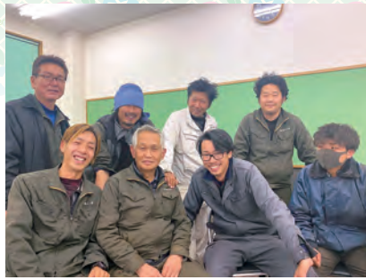
和やかな職場です

当社は、土木工事から電気工事まで買って施工を行っている建設会社です。「優しく」「正しい」姿勢で臨むという理念を掲げております。仕事に対して誠意を持って臨む態度は、この理念から生まれると思っております。そして、仕事だけでなく、全てのことに通ずるかと考えております。