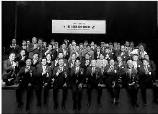
新年度がスタートした

Change & Challenge(変革と挑戦の1年に1次代への新たな飛躍を求めて)をスローガンに新年度がスタートした。また、11月に行われる日本商工会議所青年部 第39回全国会長研修会「山紫水明の地 茨城つちうら会議」と共に地域と日本の未来へのPRキャラバンが行われ、大会開催に向けて心を一つにした。