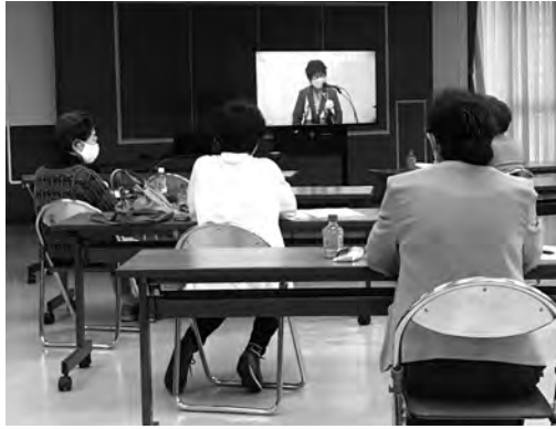
オンラインで参加するメンバー

5月18日に関東商工会議所女性会連合会2021年度総会「横浜大会」が開催されました。毎年、関東地区の女性会メンバーとの交流を楽しみに参加しておりますが、今年は残念ながらコロナ禍の影響で、オンラインでの開催となりました。今回はオンライン開催なので、普段参加できないメンバーにも声をかけ、5月例会として開催いたしました。メンバー11名が参加しております。