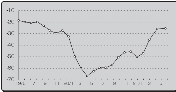
■業況DI (全産業・前年同月比) の推移■