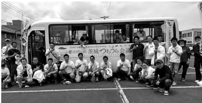
清掃に参加したメンバー

さる5月15日（土）、組織拡大・親睦委員会が主管となり、5月例会としてつくばパープルラインにてゴミ拾い作業を行いました。天候に恵まれ、現地では3グループに分かれて、車やサイクリストの往来に気を付けながら、昼までの作業でトラック2台分のゴミを拾いました。不法投棄された家電や家具、食品の袋など特に多く、皆で汗を流し、道も心もきれいになりました。