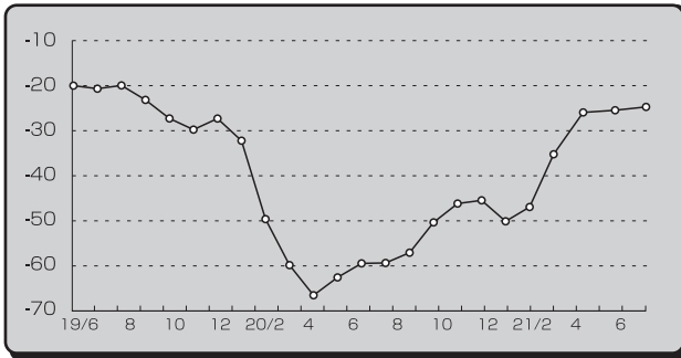
■業況DI (全産業・前年同月比) の推移■