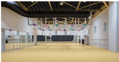
フィットネススタジオ

のトレーニングマシンによりシニアアップや筋力アップが可能になります。7月にマシン大幅増設予定!! ・スタジオ：ジョイフルでは3つのスタジオ約100本のプログラムを実施中。会員の方はすべて無料で参加できます。心肺機能を鍛える有酸素プログラムから癒し系のヨガなど。 ・プール：25m×14コース+水中ウォーキング専用コースの大きなプールで爽快に運動ができます。泳ぐだけでなくアクアビクスやウォーキングも有効です。 ・テニス：6面のテニスコートでは、はじめての方から上級者まで楽しめるスクールを行っています。はじめての方でも安心のレンタルラケット無料貸出!