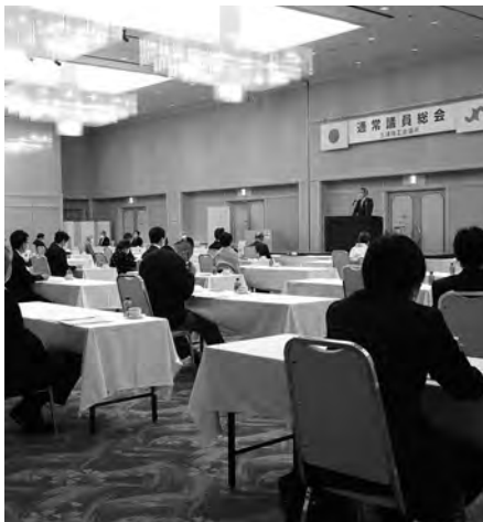
第100回通常議員総会