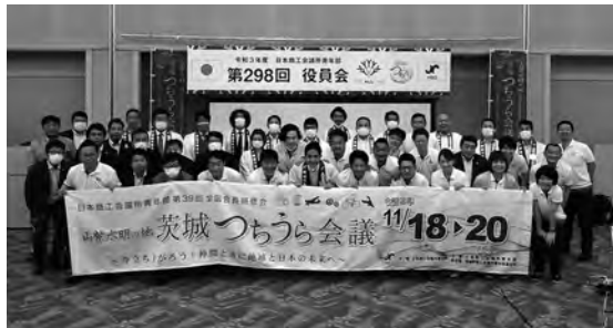
参加した日本YEG執行部・土浦YEGメンバー

また、当日朝には「朝活」として、サイクリングを予定していましたが雨天予報のため、土浦駅前から亀城公園までのウォーキングを行い、土浦の魅力を歩きながらお伝えしました。