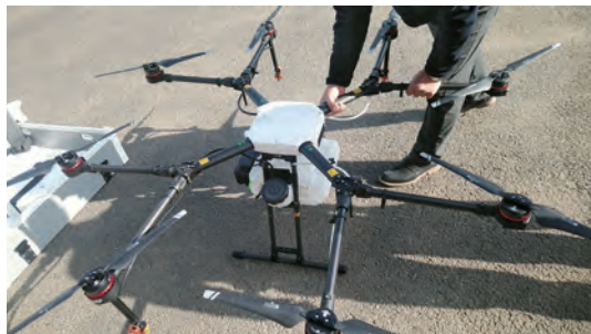
太陽光パネル洗浄用ドローン