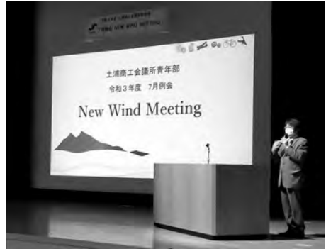
講師による「YEGによる政策提言」の講演

7月20日（火）、7月例会を政策提言委員会が担当し、茨城県県南生涯学習センターにて実施しました。「NEW WIND MEETING」とは、若手経営者であるYEGメンバーと行政職員とが、地域の課題について話し合う場として以前から行われてきたものです。しかし、コロナ禍において行政職員を招いての設営は難しいため、今回は①平成30年度に市へ提出した政策提言書の現状における回答についての検証②日本YEGみんなの政策提言委員会の委員長・副委員長を講師として招き、YEGの政策提言について、事例を交えて深く学ぶという事業を行いました。この2つを生かして、今年度版の政策提言書を作成していく予定です。