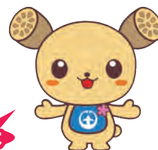
土浦市イメージキャラクター つまぐる

生ごみを資源化することで、 ごみを減量 することができ、 食品ロス が問題となっている昨今、 事業者のイメージアップ にもつながります。持続可能な地球の未来のために、事業者が積極的に環境問題に取り組みましょう。