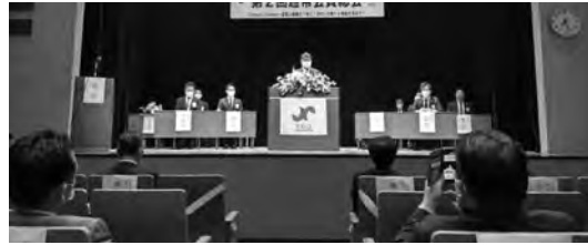
池田次年度会長予定者

また、27日（水）には、第39回全国会長研修会「山紫水明の地 茨城つちうら会議」の全体説明会を茨城県県南生涯学習センターにて行いました。土浦だけでなく、県内のYEGメンバーの皆さまに当日のお手伝いをいただくにあたり、流れや役割分担などを説明しました。残された期間でみんなまで精一杯準備を進め、成功に導けるように頑張ります。