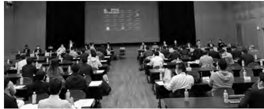
全国会長研修会「茨城つちうら会議」全体説明会