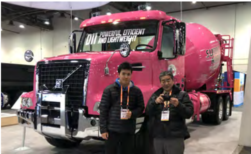
優秀社員賞（ラスベガス研修）

MEMBER'S NOW! 掲載事業所募集 ~あなたの企業、店舗・技術の情報を掲載してみませんか~ 事業案内、人物紹介、新製品や商品紹介 etc...会員企業の情報を当所職員が取材の上、無料で掲載させていただきます。 お気軽にお電話ください（総務課 822-0391 まで）。