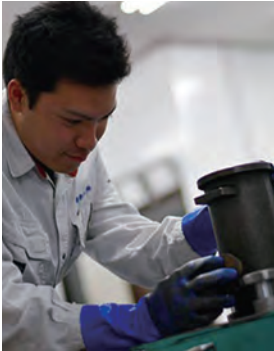
コンクリートの品質検査