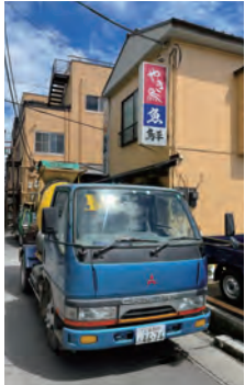
狭い路地でも納品可 2tミキサー車