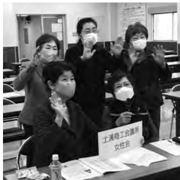
オンラインで参加するメンバー