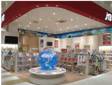
イオンモール土浦店店内