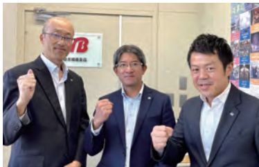
法人営業スタッフ