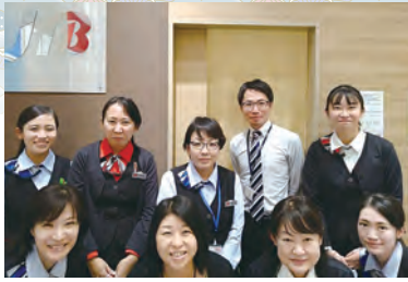
イオンモール土浦店スタッフ