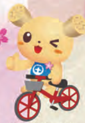
土浦市イメージキャラクター つちまる

桜名所めぐりで、看板からキーワードを探しエントリー。抽選で賞品ゲット!! ※詳しくは土浦市観光協会HPをご覧ください。