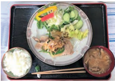
職員達が毎日楽しみにしているボス飯

労働関係法は年々複雑になり、企業はいろいろな対応を求められています。そんな企業をしっかりとサポートするためには、知識の集積と継承がとても重要です。そのために、社会保険労務士事務所もこれからは規模拡大していかなくてはなりません。すでに大町の事務所も手狭になり、建替えや支所展開、東京進出も検討しています。皆様の利用お待ちしております。