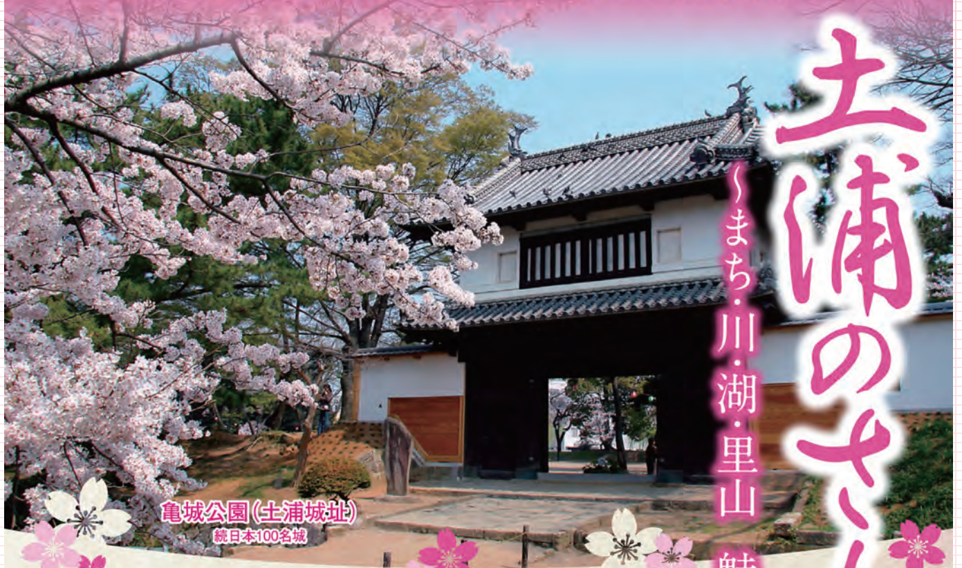
亀城公園(土浦城址) 続日本100名城