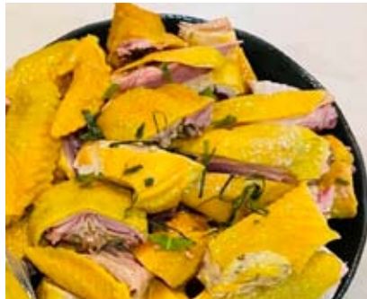
定番料理のスモークチキン