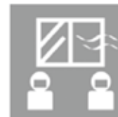
対面での打合せは換 気とマスク