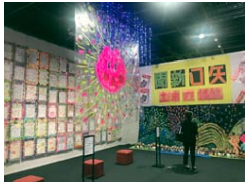
ギャラリー展示作品