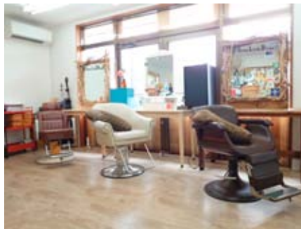
お好きな席をお選びください