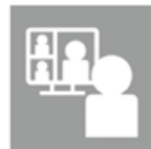
会議はオンライン