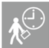
時差通勤で ゆったりと