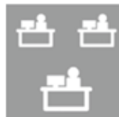
オフィスは ひろびろと