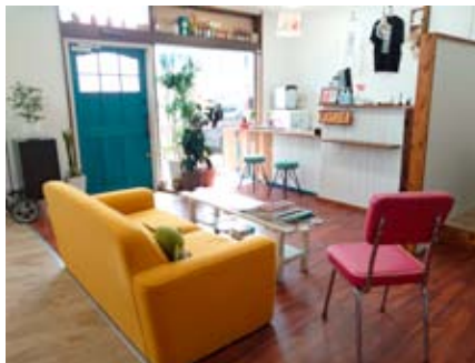
ゆっくりお待ちいただける待合スペース