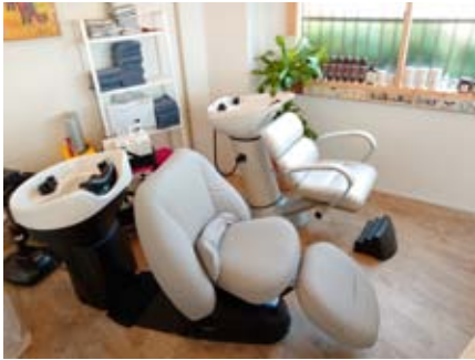
2種類のシャンプー台

技術はもちろんですが、Three Little Birdsの空間を楽しみに、またきたくなるようなお店にしていきたいと思っております。ご来店をお待ちしております。