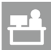
テレワークや ローテーション勤務