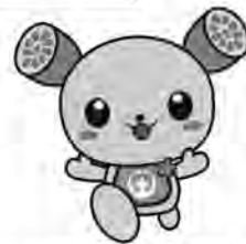
土浦市イメージキャラクター つちまる

市のごみ集積場への排出、清掃センターへの搬入はできません！ 健康被害等の危険が伴うため、適切な処理をお願いいたします。