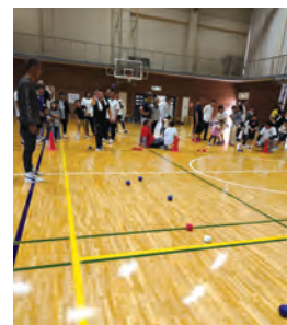
意外と難しいポッチャ