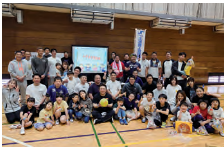
いい笑顔で集合写真

5月14日(日)水郷体育館において、50名を超えるYEGメンバーとその家族が参加し5月例会を開催しました。担当副委員長の元プロボクサーによる本気の準備体操から始まり、2チームに分かれて、ポッチャ、サーキット(腕立て伏せ・腹筋・もも上げ・バービー)、王様ドッジボールを行い、コンセプトとした「健康・親睦・笑顔」あふれる運動会になりました。入会希望者も参加し、気持ちのいい汗を流せて、結末も固まり今年度のいいスタートが切れました。