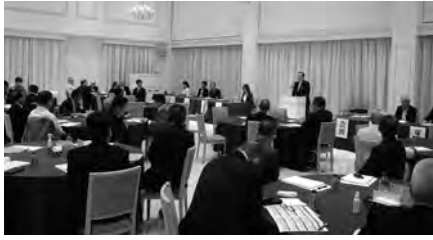
第104回通常議員総会