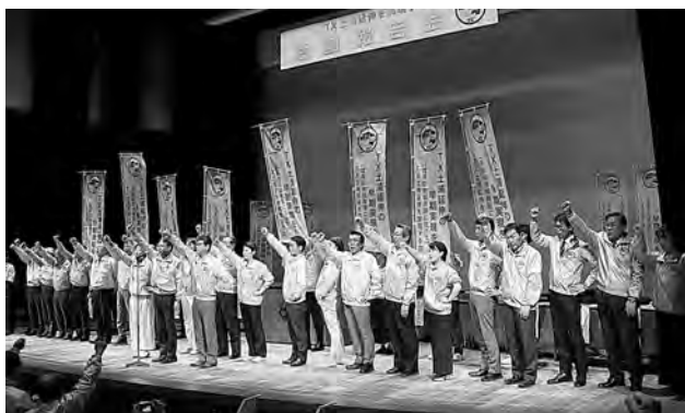
TXの土浦延伸早期実現に向けて参加者全員で「がんばろうコール」を行った。

さらに、延伸実現に向けて、参加者全員で「がんばろうコール」を行い、活動報告会は盛会裡に終了した。