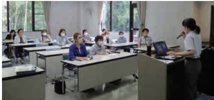
史跡や歴史について学ぶ

6月29日（木）上高津貝塚ふるさと歴史の広場において、6月例会を開催しました。今回は土浦市の土浦いきいき出前講座の「遺跡から学ぶ土浦の歴史」を利用し、国指定史跡である上高津貝塚の歴史を学びました。当日は11名が参加し、近くに全国的にも貴重な史跡があることを再認識することができ、また説明を聴きながら見学することにより、わかりやすく大変勉強になったと好評でした。今後も工夫を凝らして、皆が参加したいと思うような事業を企画し、活動していきたいと思っております。