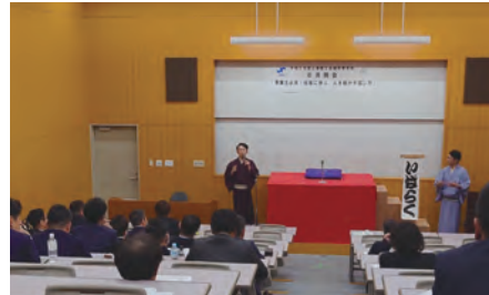
出されたお題からその心を考える

土浦商工会議所青年部ホームページ https://tsuchiura-yeg.com 青年部メンバー募集中!! お気軽にご連絡ください 詳しくは商工振興課まで