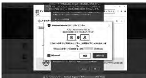
「警告画面が次々と全画面で開く」画面事例

安心相談窓口日より「会社や組織のパソコンにセキュリティ警告が出たら、管理者に連絡！」はこちら