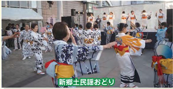
新郷土民謡おどり

土浦の夏を彩る「土浦キララまつり2023」が8月5日、6日の2日間にわたり 市内目抜き通り、旧水戸街道（中城・本町通り）を中心に開催され14万人の観客を集めた