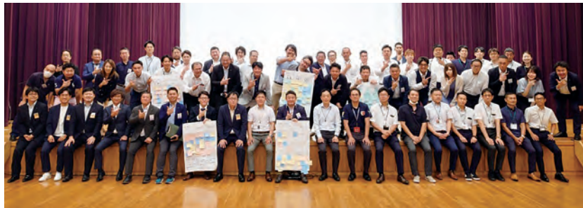
参加者みんなで集合写真