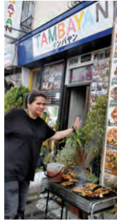
BBQイベント(毎週土曜日)