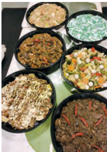
テイクアウト料理

お知らせしています。 【Tambayan Resto Bar】で検索。 ぜひ一度、ママ自慢の料理を食べに来てください。お気軽にご来店お待ちしております。