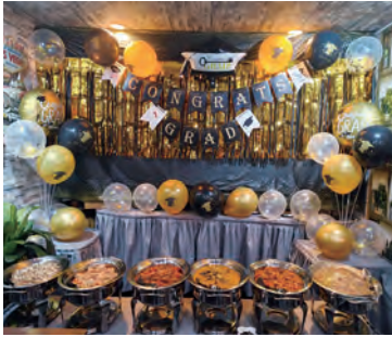
パーティー予約受付中

当店は、2017年10月にオープンしたフィリピン料理の飲食店です。料理・ドリンクは、ほとんど500円。楽しく!!安く!!おいしい!!をモットーに、日本の方に合うフィリピン料理はもちろん、カラオケで歌って踊って、楽しんでいただく空間をご提供しています。