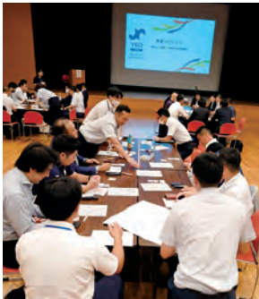
グループワーク中