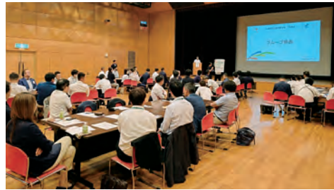
グループごとの発表

7月19日（水）茨城県県南生涯学習センターにて、土浦市役所若手職員、（一社）土浦青年会議所、土浦市新治商工会青年部メンバーの皆さまにご参加いただき、7月例会を開催しました。官民若手メンバー交流のNEW WIND MEETINGも8回目を迎え、久しぶりに懇親会まで含めたフル開催で、5つのグループごとに選んだテーマで土浦の「未来」について意見を出し合い、有意義でカジュアルな関係づくりのきっかけとすることができました。