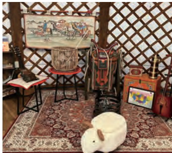
モンゴルの楽器を体験できます

特徴的な丸い構造は、悪いエネルギーが残らず天井から抜けていくとされ縁起が良いといわれています。また、冬の寒さや夏の暑さにも強いのも特徴のひとつです。当施設のゲルは、特殊な技術で作られている13世紀時代のモデルです。3種類の部屋タイプがあり、2〜5人までご利用いただけます。各部屋には、大型B B Qグリルがあり、屋根付きプライベートデッキなので天候を気にせず楽しめます。また、気軽にモンゴル文化を楽しめる伝統衣装の体験撮影コーナーや物産コーナー、伝統料理焼き肉「ホルホグ」をご用意しております。