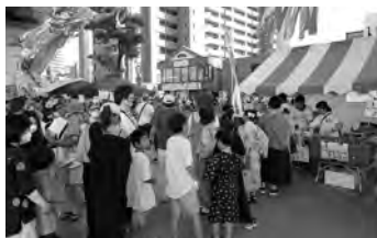
かき氷は大にぎわいでした