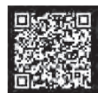
マンガ 再就職支援