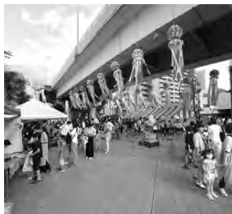
天気にも恵まれ多くの来場者であふれていきました

久しぶりのフル開催となったキララまつりに、土浦YEGは従来通りのちびっこ広場と飲食ブースを出店しました。ちびっこ広場では、縁日をイメージした射的、ストラックアウト、スーパーボールすくい、当てくじ、ストラックライン体験を行列が絶えないほど多くの子供たちに楽しんでもらいました。飲食ブースはちびっこ広場のエリアだけでなく、大徳駐車場広場にも出店し、かき氷や新メニューのホルモン焼そばも好評で、暑い中予想以上の活気があり盛大に開催できました。