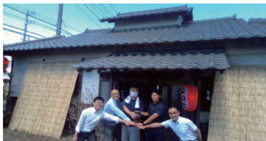
秘伝のニンニクだれの入った壺の受け渡しを行っている