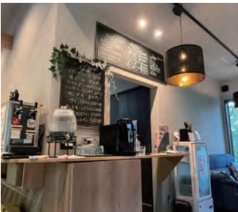
共有スペースにカフェもあります