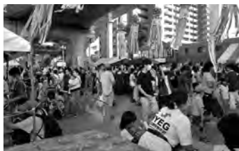
定番の射的は大人気

土浦商工会議所青年部ホームページ https://tsuchiura-yeg.com