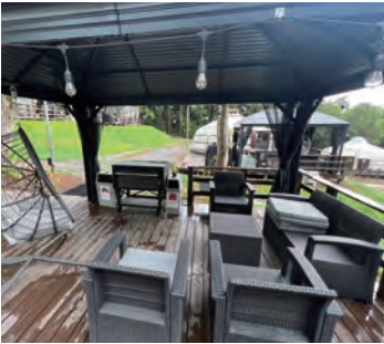
屋根つきデッキでBBQが楽しめます