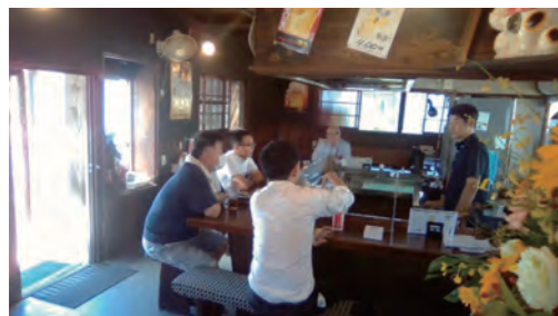
前経営者から現経営者へ事業承継にかかる熱いエピソードに皆が聞き入っている