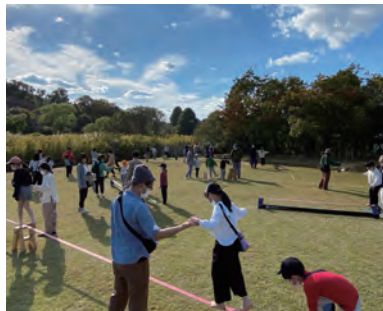
スラックライン体験