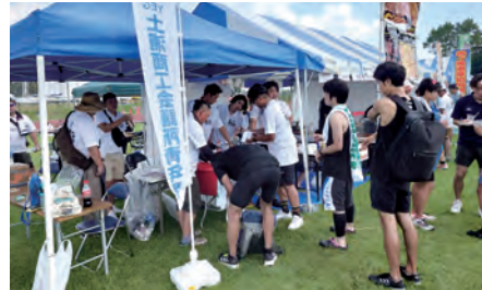
冷たい飲み物・肉巻きおにぎりは選手に大好評でした

土浦商工会議所青年部ホームページ https://tsuchiura-yeg.com 青年部メンバー募集中!! お気軽にご連絡ください 詳しくは商工振興課まで