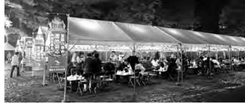
亀城公園での雰囲気も楽しんでいただきました