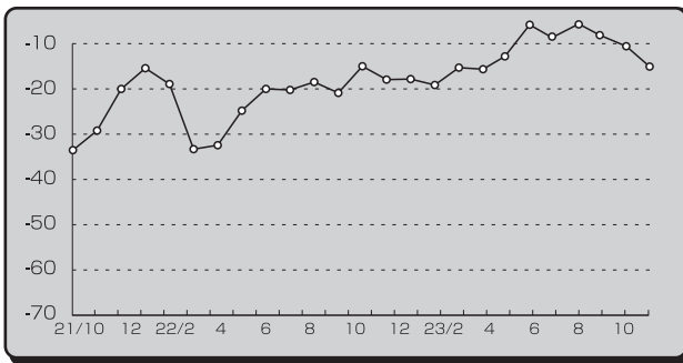
■業況DI (全産業・前年同月比) の推移■