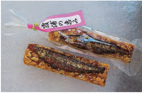
ジャパン フード セレクション金賞 霞浦の恵み

お誕生日ケーキ等のデコレーションは完全ご予約にてお作りしております。 ※クリスマスケーキはご来店・ご予約いただけるお客様のみに承ります。