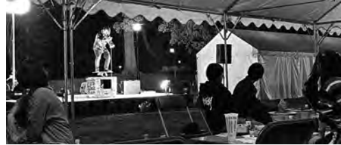
マジックショー披露中

土浦商工会議所青年部ホームページ https://tsuchiura-yeg.com 青年部メンバー募集中!! お気軽にご連絡ください 詳しくは商工振興課まで