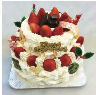
クリスマスケーキ

インスタグラムやフェイスブック、ホームページにて季節のお知らせをしております。 皆様のご来店お待ちしております。