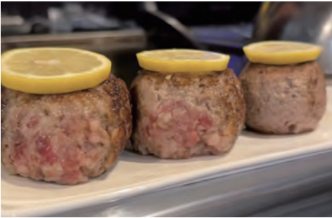
常陸牛100%のハンバーグ