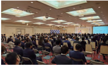
記念式典(安藤市長より祝辞)