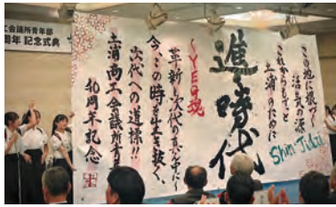
土浦二高書道部による「進・時代」