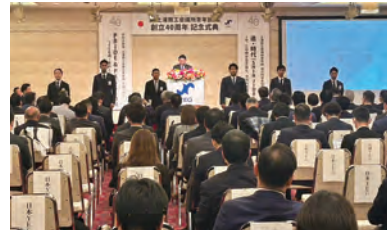
中期ビジョンを若手メンバーと発表