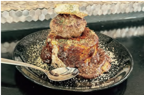
花畑牧場のカマンベールチーズを使用したハンバーグドリア