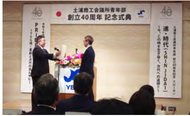
歴代会長に感謝状授与