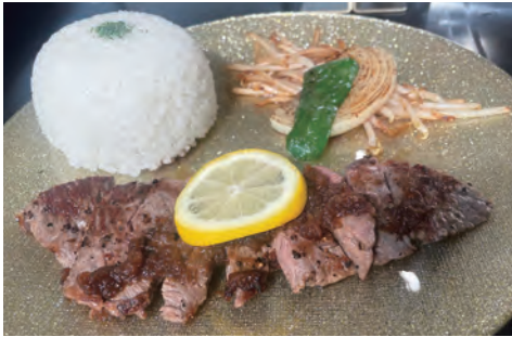
国産黒毛和牛A5ランクステーキランチ