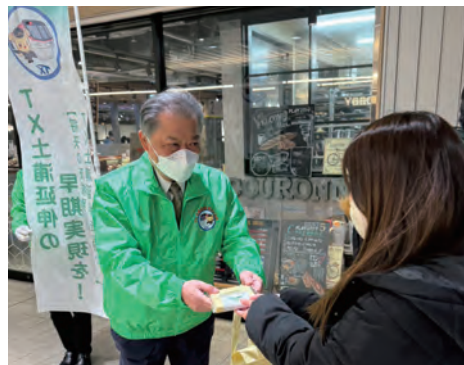
中川会頭ら、「実現する会」役員が土浦駅利用者に啓発グッズを手渡した

このような中、同会は、令和5年12月21日、JR土浦駅において街頭キャンペーンを実施。土浦延伸の早期実現に向けて機運醸成を図るため、市、市議会、商店街連合会、商工会議所等、関係者が駅を利用する方々に啓発グッズ（つちまるとTXをデザインしたトートバック）を配布し、支援・協力を求めた。