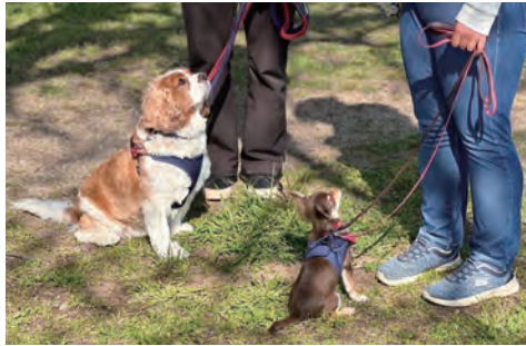
外での犬のようちえん生のトレーニング風景