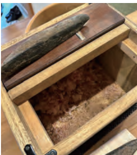
削りたての鯉節と削り器