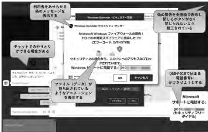
体験サイトで表示される偽のセキュリティ警告画面