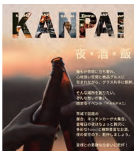
毎月開催しているイベントのKANPAI

他にもつくば駅の近くのトナリエスクエアで毎月第三週目の土曜日、日曜日に開催されているつくば蚤の市にも出店しています。