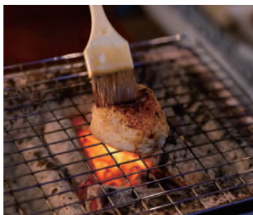
にゃんこまんま焼きおにぎり

と香りは本当に感動してしまいます。昨年発売して以来、好評の本節ジャーキーはペットも食べられるおやつとして販売されています。噛めば噛むほど本節の旨みが溢れ出します。本節は約75%がタンパク質です。罪悪感のないおやつ、おつまみとしては非ご賞味ください。