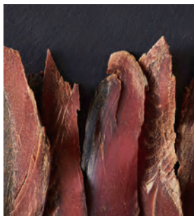
ペットも食べれる本節ジャーキー

大量生産の鯉節ではなく厳選した原料を使用しています。削りに使用している機械は2代目の祖父が使用していた今でも現役の鳥羽式で削っています。中でも最高級の鯉節の本節は一本釣りで釣り上げたものを2年間かけてカビ付けして熟成させたものを使用しています。調味料を使用する必要がないぐらい熟成した味わい