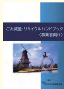
【ごみ減量リサイクルハンドブック】

【問合せ先】土浦市市民生活部環境衛生課クリーン推進係 826-1111（内線2474）